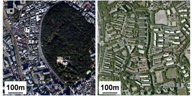
図1. 土地の節約戦略(左)と土地の共有戦略(右)

状態が良好であることが分かった。これまでの申請者の研究から、「土地の共有」戦略型の都市に住む人ほど緑地の利用頻度が高いことが分かっている。また、緑を景観全体に配置する「土地の共有」戦略ほど、必然的に自宅の窓から見える緑の量は多くなると考えられる。以上の点を踏まえると、人々のメンタルヘルスの観点から見た場合は「土地の共有」戦略の方が望ましいと考えられる。